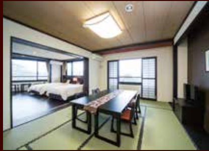
デラックス和洋室