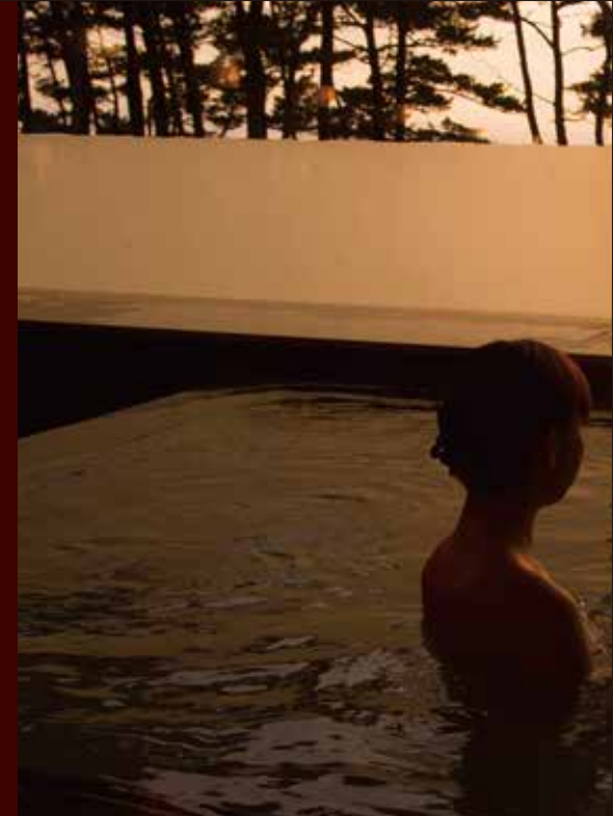
日本海の夕陽に染まる贅沢な時間