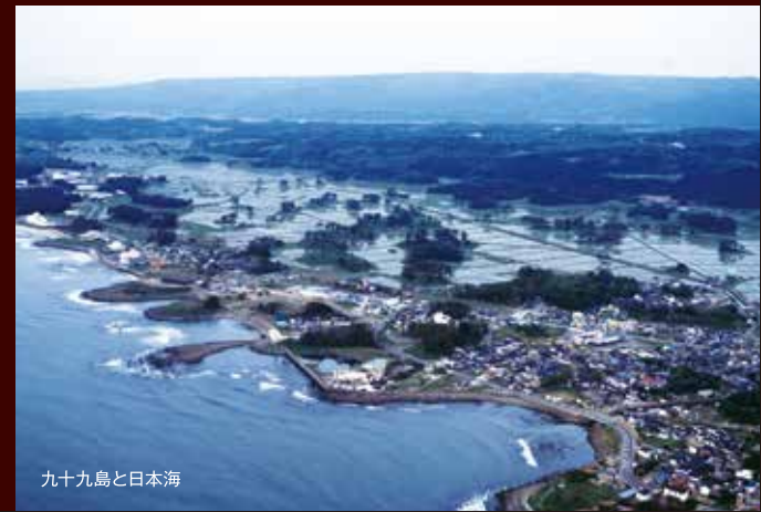
九十九島と日本海