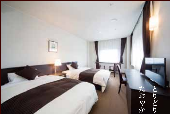
洋室 ※写真はスタンダードツインルーム